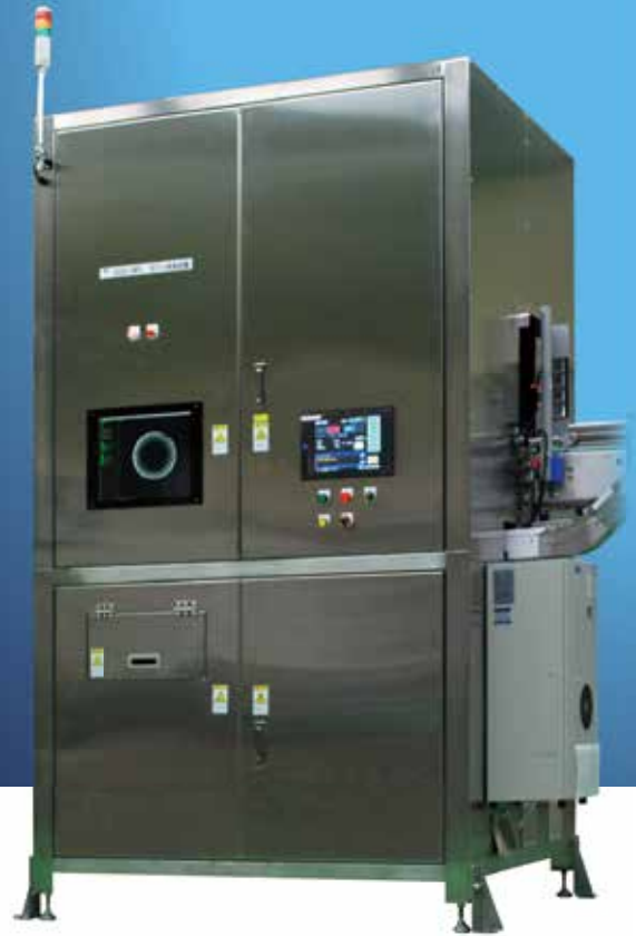
■ びん口検査画像 (欠け)

充填前の空びんを複数のカメラで撮像し、不良品を検出します。ストレート搬送を採用し、インラインで高速・高精度に自動検査を行います。